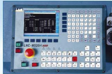
控制器 本機採用寶元 (LNC-M520H HPS) 四軸控制器 (可搭配其他廠牌控制器，供客戶自行選配) Control Panel (LNC-M520H HPS) Note: Equip with other brand one if customer ordered.